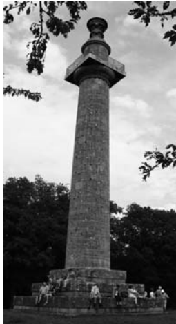
Konstitutionssäule bei Volkach