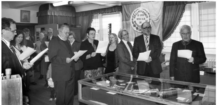
Gemeinsames Singen bei der Ausstellungseröffnung