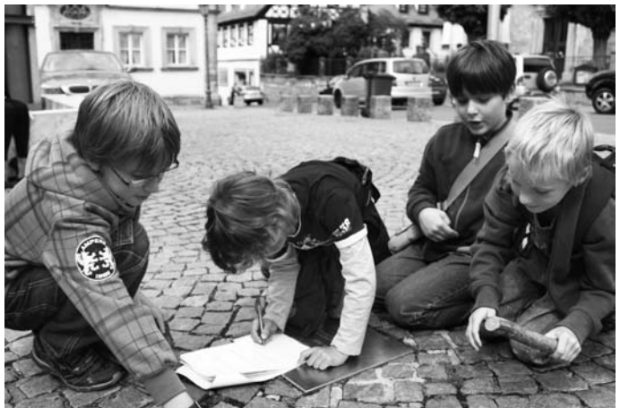
Die Jungs beim Lösen der Aufgaben auf dem Eberner Marktplatz.

Seit es das Ferienprogramm in Ebern gibt, beteiligt sich der Bürgerverein daran und hat in der Vergangenheit viele schöne und interessante Angebote gemacht. In den letzten Jahren steuerten wir zur Freude der Kinder stets eine (für uns defizitäre) Aufführung des Kindertheaters Chapeau Claque bei. Heuer stand eine Stadtrallye auf dem Programm. Über 30 Kinder nahmen in Gruppen von je 3 Personen mit großer Begeisterung teil und die allermeisten lösten die z.T. recht anspruchsvollen Aufgaben mit Bravour. Belohnt wurden die Kinder mit einer kleinen Stärkung im Heimatmuseum, es gab Wienerle mit Brötchen, und schließlich erhielt noch jedes Kind eine Kugel Speiseeis.