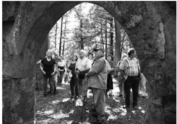
Helenenkapelle zwischen Baunach und Kemmern