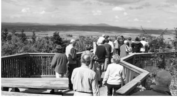
Blick in den Grabfeldgau mit den Gleichbergen